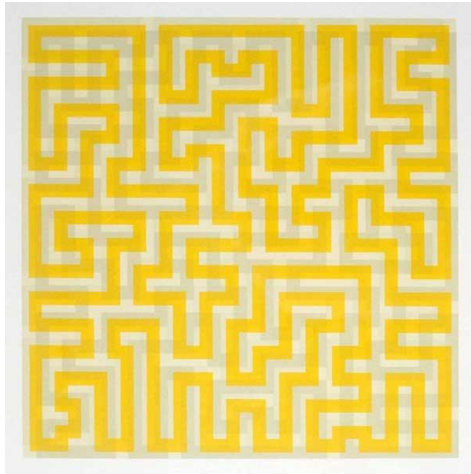
Anni Albers, Yellow Meander

Bienvenue dans le laboratoire Pays germaniques de l'École normale supérieure !